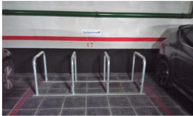
PARKING DE BICICLETAS