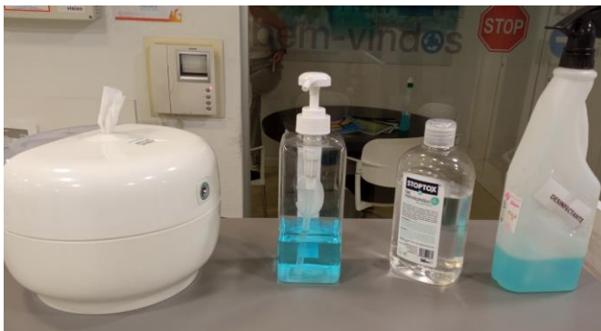
GEL DESINFECTANTE ANTI-COVID