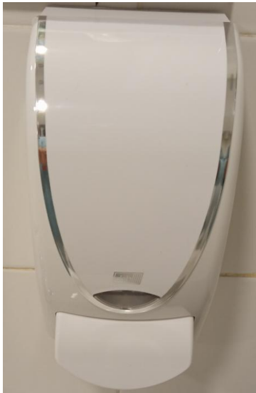
DISPENSADOR DE GEL