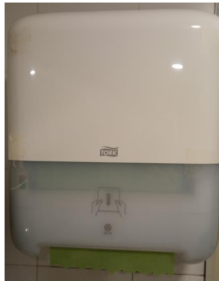
DISPENSADOR DE PAPEL DE BAÑO