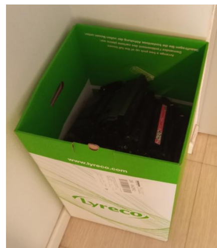
CONTENEDOR DE TONER