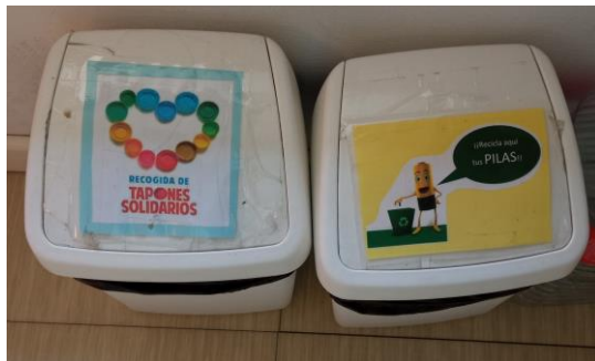
CONTENEDOR TAPONES Y PILAS