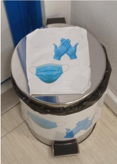
CONTENEDOR DESECHABLES ANTI-COVID