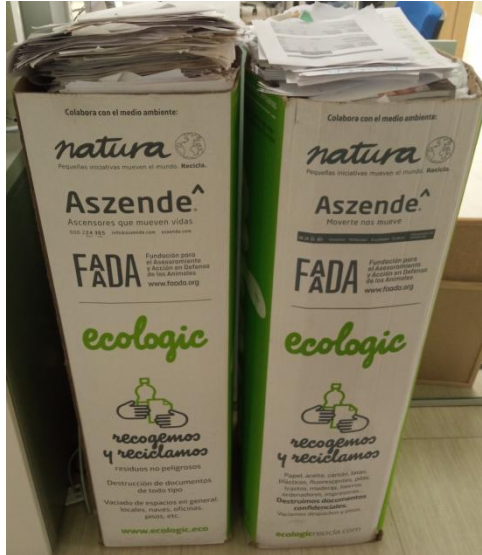
CONTENEDOR PAPEL RECICLADO